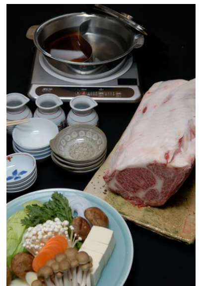
極上米沢牛のしゃぶしゃぶです！

4階は純和室の料亭「鉢の木」と茶室「夢語庵」の2部屋です。お庭を眺めながらのご会席会席料理で大切なお客様のご接待にご利用下さいませ。ぜひ一度ご来店下さい！